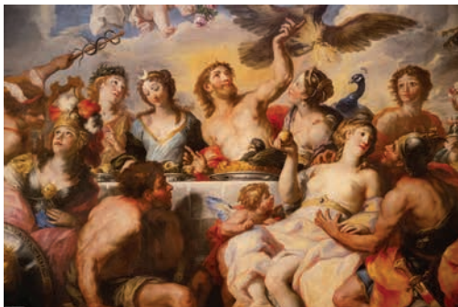
Rottmayr, Detail aus dem Deckengemälde im Thronsaal, um 1689